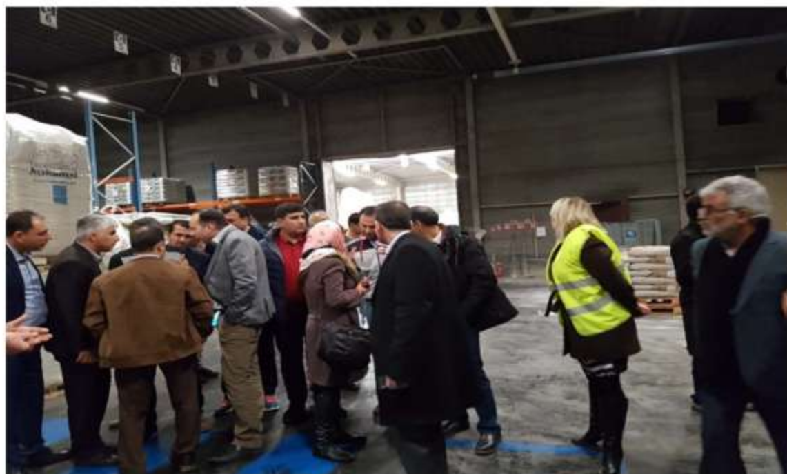
Visit to Nukamel production line- Weert- Netherlands- February 16 th 2017

Technology Units Incubator, Shahid Beheshti University, Daneshjoo St., Velenjak, Tehran, IRAN. Post Code: 1983963113 Tel: +98(21)22419445 Fax: +98(21)22419445 Web Site: www.pezhvac.com E-mail: info@pezhvac.com Reg. Code.:462000 National code:14004474063