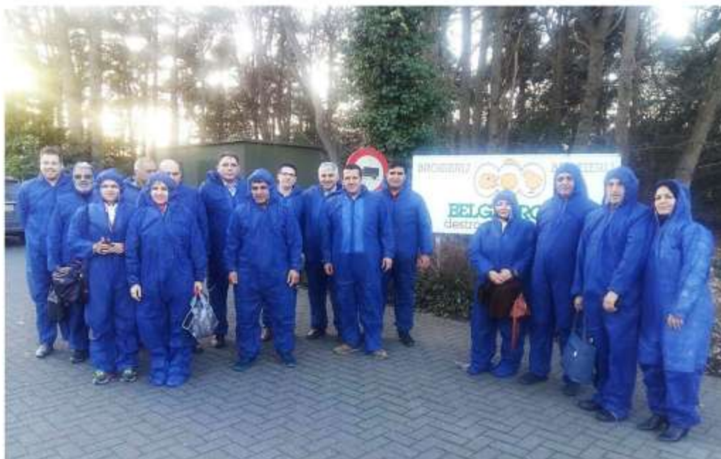
Visit to Belgbroed hatchery – Merksplas- Belgium- February 15 th 2017

پژواک پژوهش آینده کاوش اسپین خاسا Research & Innovation Co.