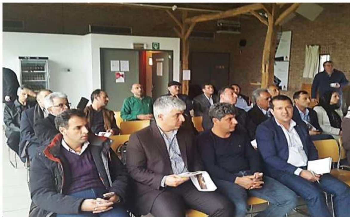
Visit to poultry institute and meeting- Geel- Belgium- February 15 th 2017

پژواک پژوهش آینده کاوشی سپهر خاستا Research & Innovation Co.