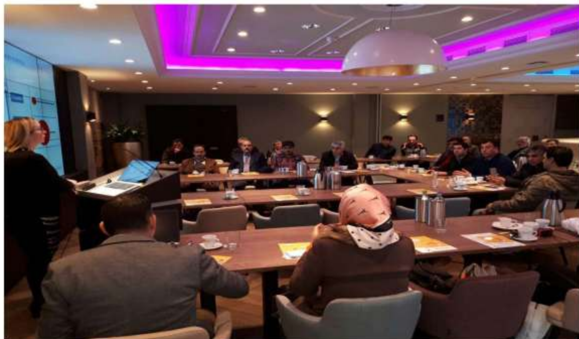
Presentation and question and answer meeting- Weert- Netherlands- February 16 th 2017

پژواک PEZHVAC پژوهش آینده کاوش آمیخته دانش Research & Innovation Co.