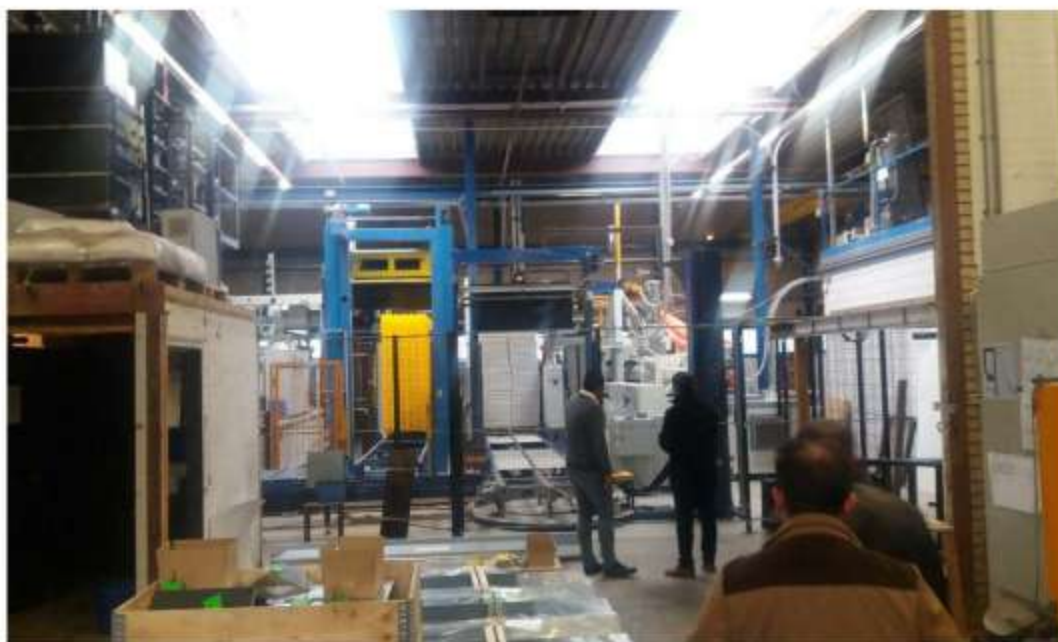
Visit to manufacturing line of Jonsen Poultry Equipment Site- Barneveld- Netherlands- February 17th 2017

Technology Units Incubator, Shahid Beheshti University, Daneshjoo St., Velenjak, Tehran, IRAN. Post Code: 1983963113 Tel: +98(21)22419445 Fax: +98(21)22419445 Web Site: www.pezhvac.com E-mail: info@pezhvac.com Reg. Code.:462000 National code:14004474063