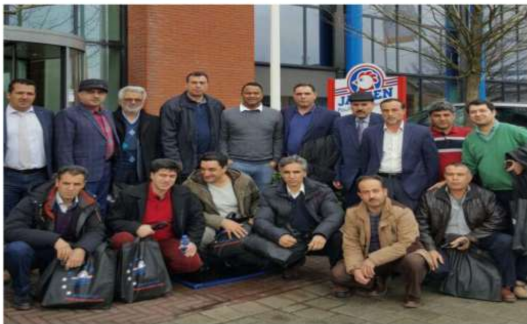
Visit to Jonsen Poultry Equipment company –Barneveld- Netherlands- February 17 th 2017

پژواک پژوهشی آینده کاروانی اسپین خاسا Research & Innovation Co.