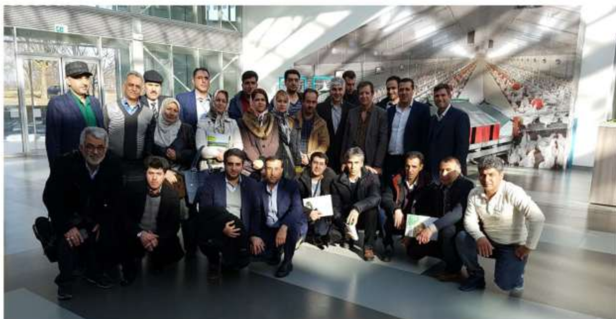
Visit to Venco Campus of Vencomatisgroup- Eersel- Netherlands- February 14 th 2017

Technology Units Incubator, Shahid Beheshti University, Daneshjoo St., Velenjak, Tehran, IRAN. Post Code: 1983963113 Tel: +98(21)22419445 Fax: +98(21)22419445 Web Site: www.pezhvac.com E-mail: info@pezhvac.com Reg. Code.:462000 National code:14004474063