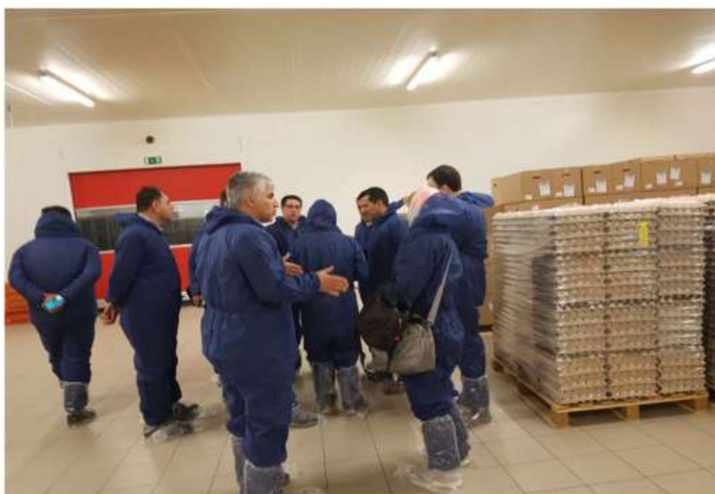
Visit to Belgbroed hatchery – Merksplas- Belgium- February 15 th 2017

Technology Units Incubator, Shahid Beheshti University, Daneshjoo St., Velenjak, Tehran, IRAN. Post Code: 1983963113 Tel: +98(21)22419445 Fax: +98(21)22419445 Web Site: www.pezhvac.com E-mail: info@pezhvac.com Reg. Code.:462000 National code:14004474063