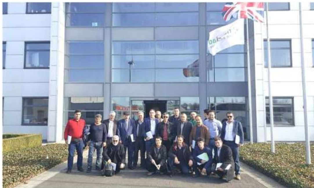
Visit to INVE België Company – Dendermonde – Belgium- February 15 th 2107

پژواک پژوهش آینده کاوشی اسپین خاسا Research & Innovation Co.